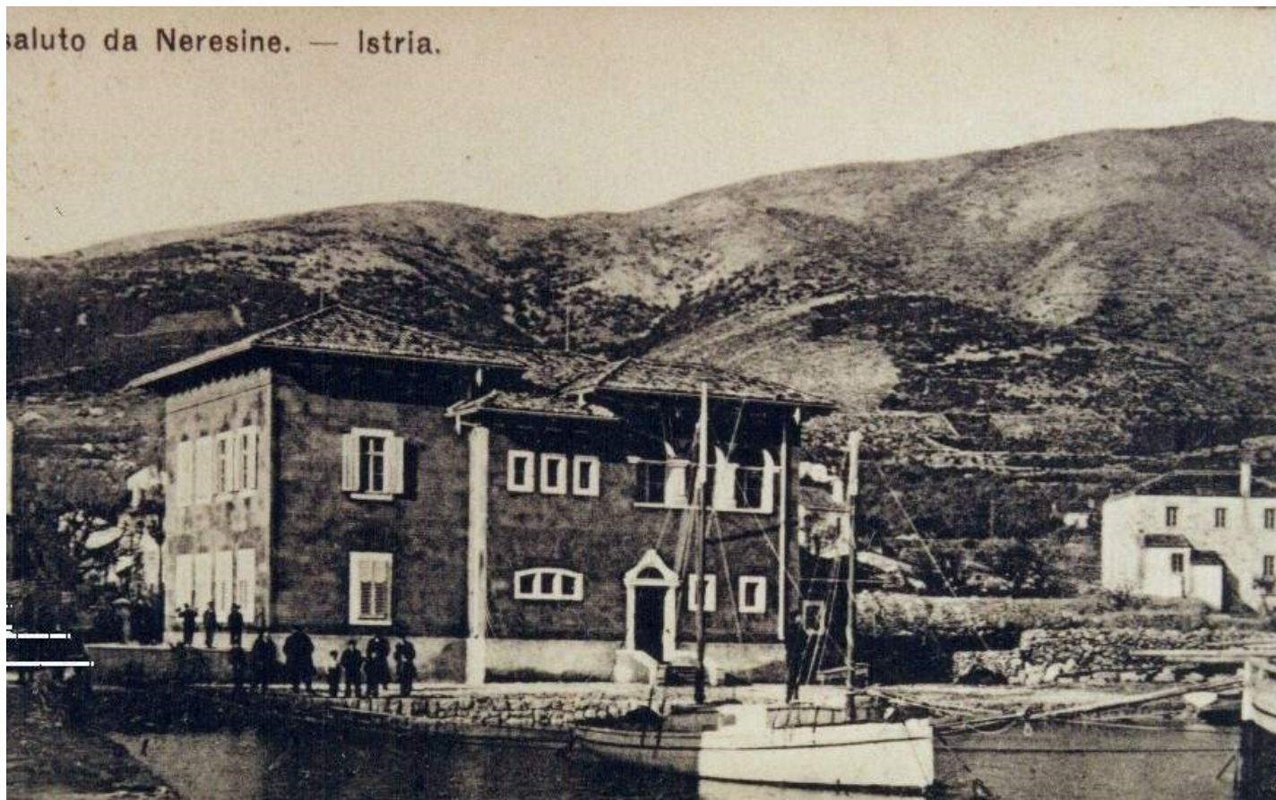
L'antico Municipio di Neresine