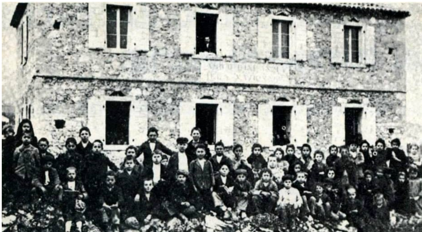
Asilo d'infanzia della Lega Nazionale a Neresine (inizi del '900)