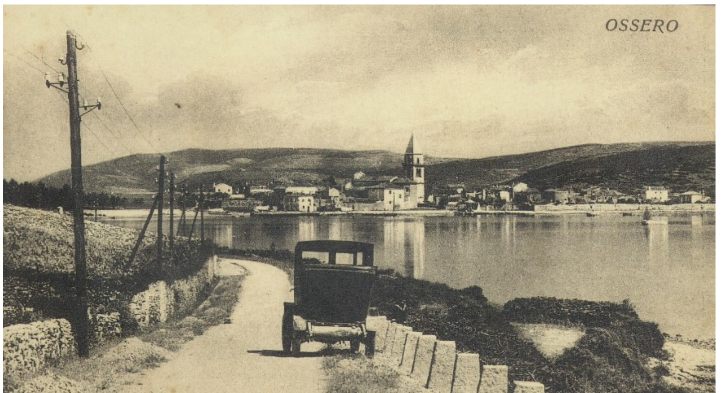
Strada Neresine - Ossero