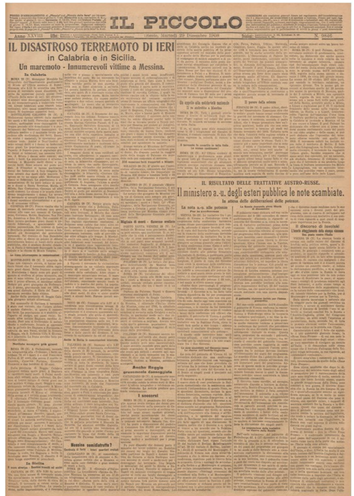
Prima pagina: l'annuncio del terremoto di Messina e Reggio Calabria del 28 dicembre 1908

Domenica, prima dell'inizio dell'atto elettorale il signor Elio Bracco parlò in pubblico comizio raccomandando vivamente gli elettori di accorrere compatti alle urne e spiegò le subdole manovre dei clericali che, in seguito a ignobili accordi presi coi clerico-croati, avevano l'appoggio di questi ultimi. Nessuno dei nostri mancò all'appello. Gli avversari capitanati dai loro capocchia accorsero tutti all'urna e votarono